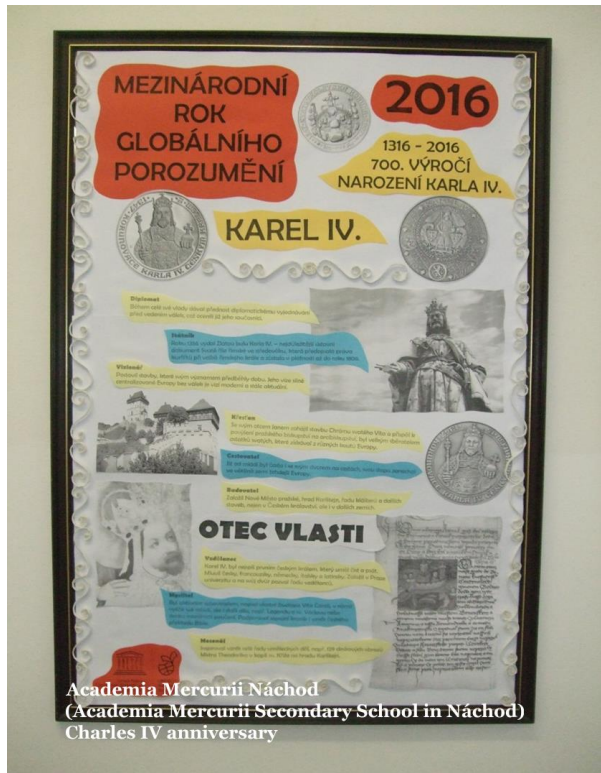
Academia Mercurii Náchod (Academia Mercurii Secondary School in Náchod) Charles IV anniversary