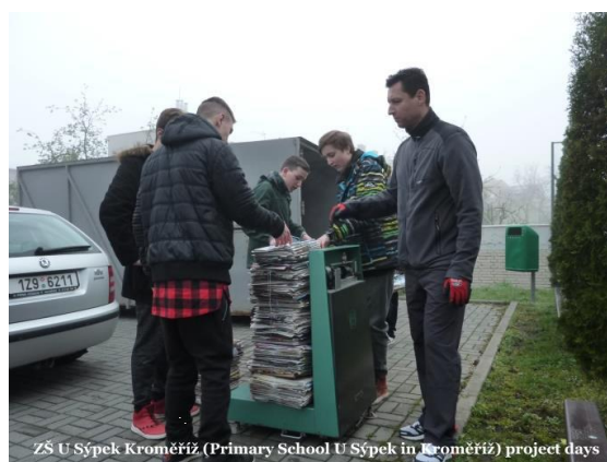
ZŠ U Sýpek Kroměříž (Primary School U Sýpek in Kroměříž) project days