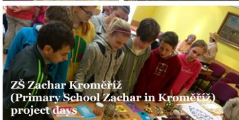
ZŠ Zachar Kroměříž (Primary School Zachar in Kroměříž) project days