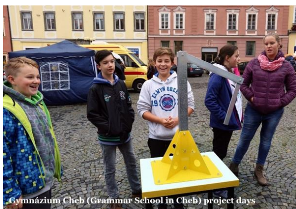
Gymnázium Cheb (Grammar School in Cheb) project days

s národními parky a chráněnými krajinnými oblastmi či zoologickými zahradami, pořádají akce ke Dni Země), (3) občanská společnost (komunitní dny, model OSN, žákovské a studentské parlamenty, školy se zapojují do projektů Příběhy bezpráví, Dialog přes hranici, Jeden svět na školách aj.), (4) jazyk a literatura, jazykové vzdělávání (školy organizují jazykové pobyty a zapojují se do projektů Noc a Andersenem, Evropský den jazyků aj.), (5) charitativní projekty (školy organizují rozličné sbírky a zapojují se do projektů Adopce na dálku, Bílá pastelka, Světlo pro světlušku, spolupracují také se zdravotnickými zařízeními), (6) věda (školy se účastní projektu Týden vědy pořádaném Akademií věd ČR a dalších projektů v této oblasti), (7) kultura a umění (na školách existují umělecké kroužky a dílny, školy se zapojují do projektů Dny evropského dědictví, Týden uměleckého vzdělávání a amatérské tvorby aj.), (8) ekonomie a finanční vzdělávání (školy vyučují finanční gramotnost, účastní se projektů zakládání fiktivních firem apod.), (9) sport (na školách existují sportovní kroužky, školy se zapojují do celé řady sportovních akcí).