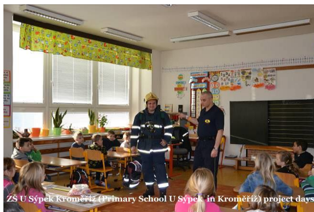
ZŠ U Sýpek Kroměříž (Primary School U Sýpek in Kroměříž) project days

České přidružené školy UNESCO pořádají pravidelně akce v rámci Týdne škol UNESCO , jehož téma stanovuje valné shromáždění. Pro školní rok 2015/2016 byla stanovena dvě témata: 70. výročí založení UNESCO a 700. výročí narození českého krále a římského císaře Karla IV. (výročí UNESCO). Školy pojaly tato témata velmi rozmanitě: tematické školní výlety a exkurze, dílny, umělecké aktivity (divadlo, hudba, tanec, film), tematické besedy a přednášky, edukativní hry. Je velmi ocenitelné, že byla tato témata zohledněna i přímo ve výuce.