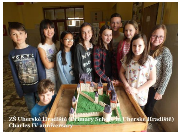
ZŠ Uherské Hradiště (Primary School in Uherské Hradiště) Charles IV anniversary

České přidružené školy UNESCO budou i nadále plnit své dlouhodobé mezioborové projekty, pořádat akce k tématu Týdne škol, kterým je pro školní rok 2017/2018 „udržitelný cestovní ruch pro rozvoj“, budou podporovat žákovské a studentské iniciativy a pokračovat ve spolupráci s partnerskými školami doma i v zahraničí.