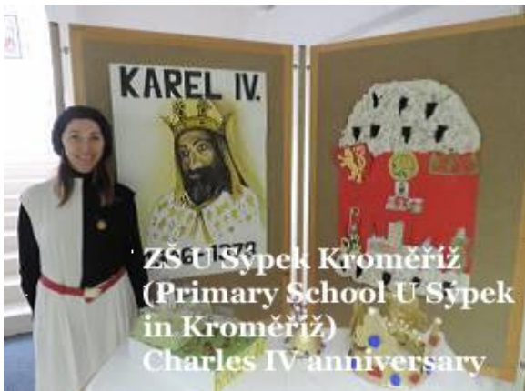
ZŠ U Šýpek Kroměříž (Primary School U Šýpek in Kroměříž) Charles IV anniversary